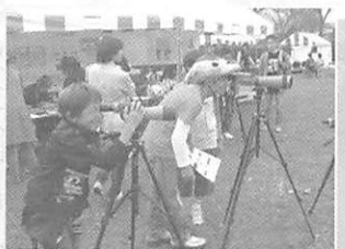
■ 藝人裝扮吸引年輕人