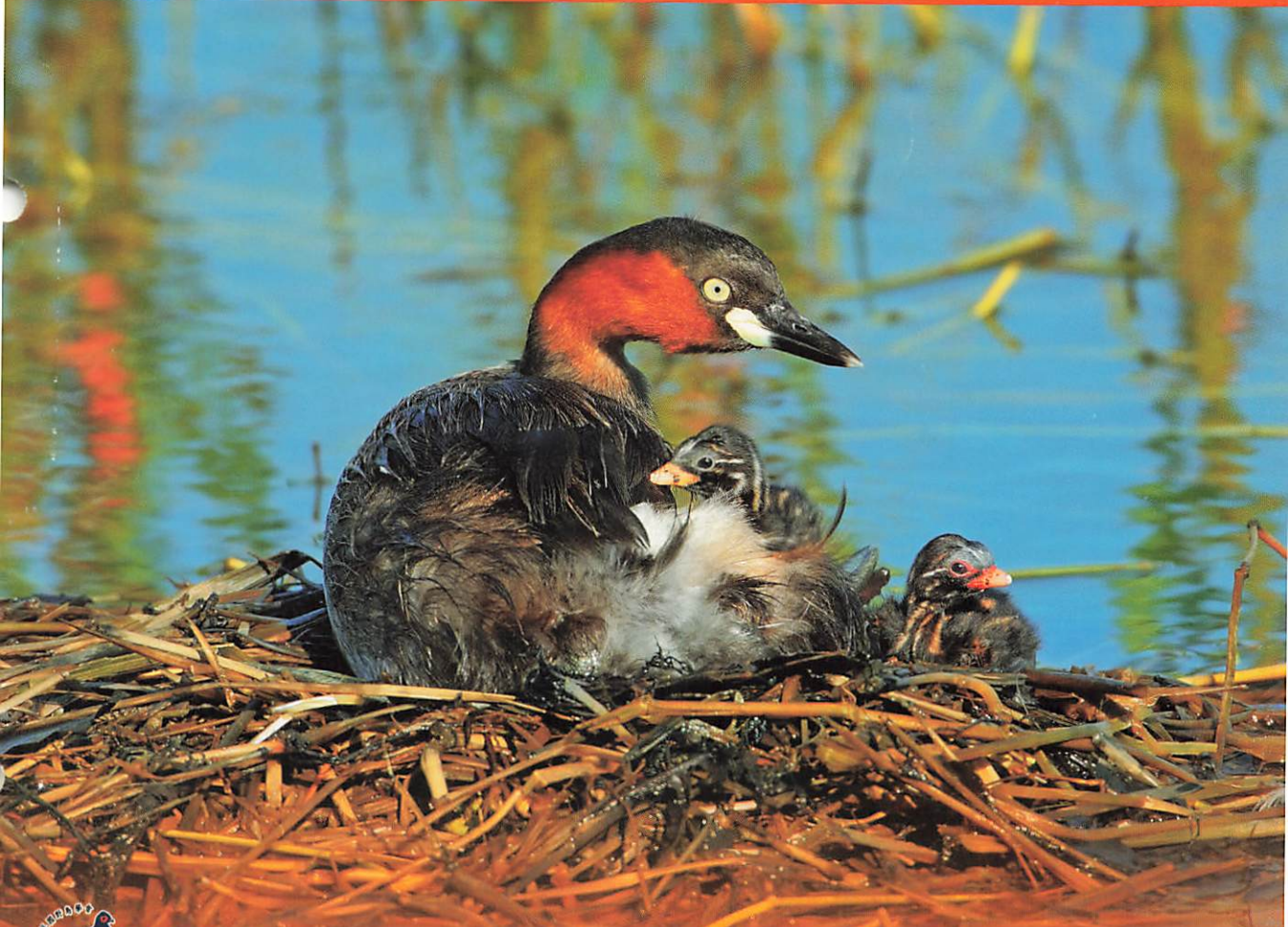
最溫暖的渡輪-鸕鶿號

地址：116 台北市文山區景隆街 36 巷 3 號 1 樓 · 電話：(02) 86631252 · 傳真：(02) 29303595