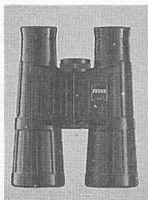
10×40 B/GA T*Classic