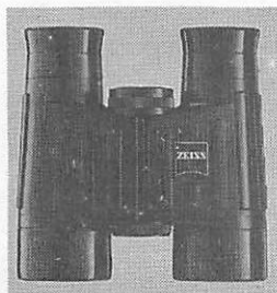
8×30 B/GA T*Classic