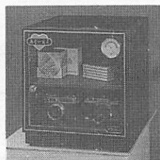
“防潮家” D-60C 容量：58公升