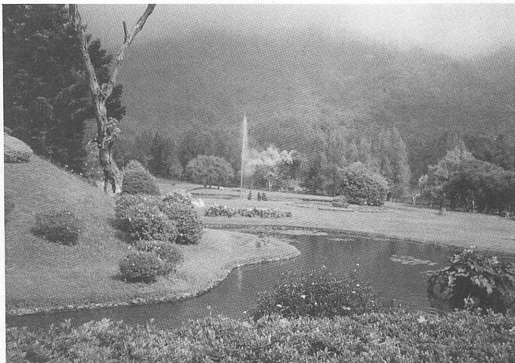
• Gede-Pangrango 國家公園入口旁植物園背景雲霧中乃是國家公園，也是賞鳥重點。