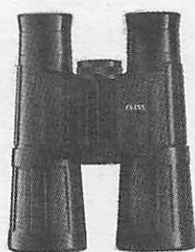
10X40 B/GA T*Classic