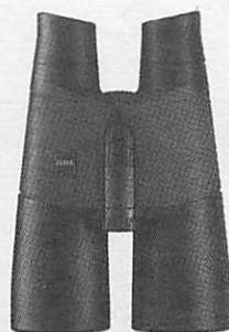
10X56 BT* Night Owl Binoculars