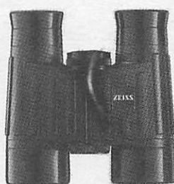
8X30 B/GA T*Classic