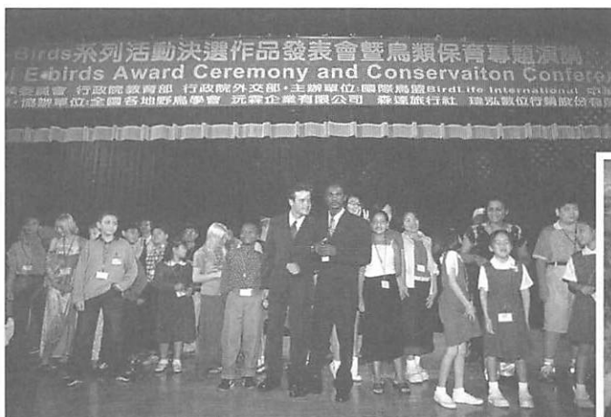
中華鳥會與國際鳥盟合辦國際性系列活動

回顧國內推動自然保育工作至今，許多方面都有相當多的改善，包括保護區域的面積、調查研究等基本資料的收集與整理、法規的訂定與執行等，尤其是社會大眾保育意識的提升與民間保育量能的成長方面更有相當大的進展，相較於許多開發中的國家而言，我國的保育工作有些是足以自豪與自我肯定之處。然而上述的保育工作仍有繼續加強改進的空間，尤其是國家整體保育政策的檢討、組織人事的調整、相關法規的修訂、保護區經營管理計畫的落實、調查監測研究訓練與教育的持續推動等等，此外政府與民間都需要掌握國際保育的趨勢，加強建立各面向的伙伴關係與促進實質的合作，推動資源永續利用面向的保育事務，同時重視全球保育議題的影響以規劃適當的因應策略。