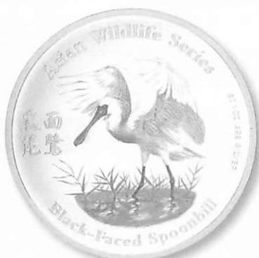
黑面琵鷺 彩色純銀紀念幣