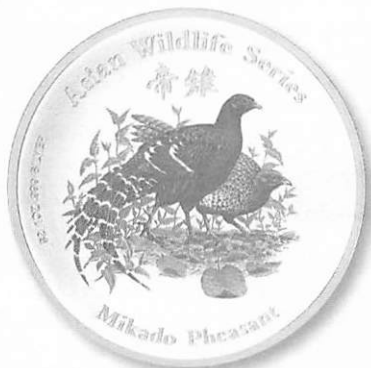
帝雉 彩色純銀紀念幣