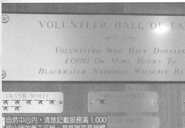
自然中心內，清楚記載服務滿 1,000 個小時的義工名稱，是感謝亦是榮耀