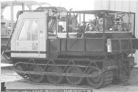
Blackwater NWR 進行引火焚燒時的工具

保存及棲地環境的維護上頭，往往僅流於禁止所有干擾行為的進行，實際的經營管理工作卻因專業人力及經費預算的不足而無法真正落實，然棲地環境會演替、族群會消長，如果不進行必要的棲地環境經營管理的工作，實有負劃設保護區之美意。另外，持續性的環境及生物生態監測工作也是相當重要的，在美國的保護區裡，由於編制有固定的人力及經費，相當重視這一個環節，如此不僅隨時掌握某些保育類物種族群變化情形，也能進而對保護區內環境動態及其他生物族群分布變化了解，對於保護區範圍的調整、棲地環境的營造與規劃，都能有最基礎的資料可以提供參考。反觀我國，由於人力物力的有限，許多保護區內環境生物及生態監測，往往在劃設後就停止了，或是依不同年期委交給不同的研究單位進行監測，如此往往因為各方層面上的調整而影響到資料累積的完整性與一致性，對於我國未來保護區整