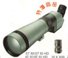
ST 80/ST 80 HD AT 80/AT 80 HD