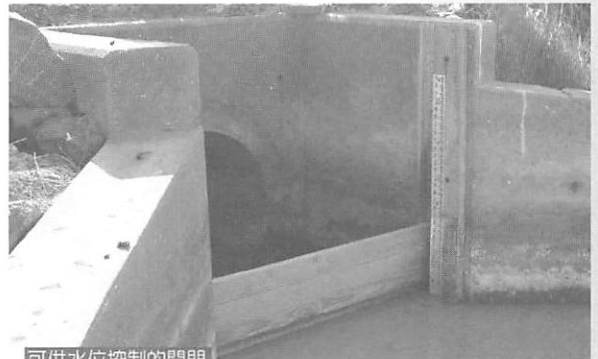
可供水位控制的閘門

在棲地的經營管理上，幾個參訪的保護區，皆有進行大量之棲地環境營造及管理工作。諸如水位控制、施作藥物、引火焚燒…等。此外還進行保護區內有害動物的移除、防治、甚至狩獵管理等工作，甚至設法再造逐漸消失的沼澤地，使保護區有多樣化的棲地以保存與復育野生動物物種。我國的野生動物保護區自民國八十年陸續公告設立以來，在物種的