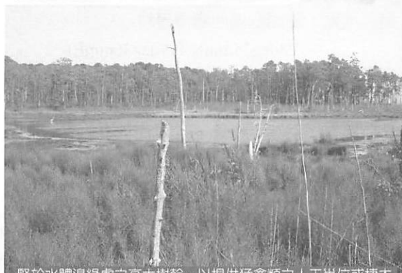
豎於水體邊緣處之高大樹幹，以提供猛禽類之人工巢位或棲木