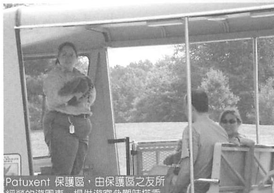
Potuxent 保護區，由保護區之友所經營的遊園車，提供遊客參觀時搭乘