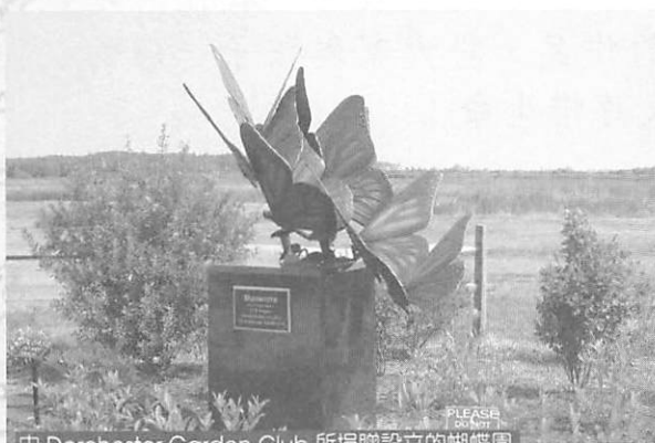
由 Dorchester Garden Club 所捐贈設立的蝴蝶園