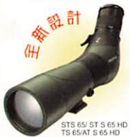
STS 65/ST S 65 HD TS 65/AT S 65 HD