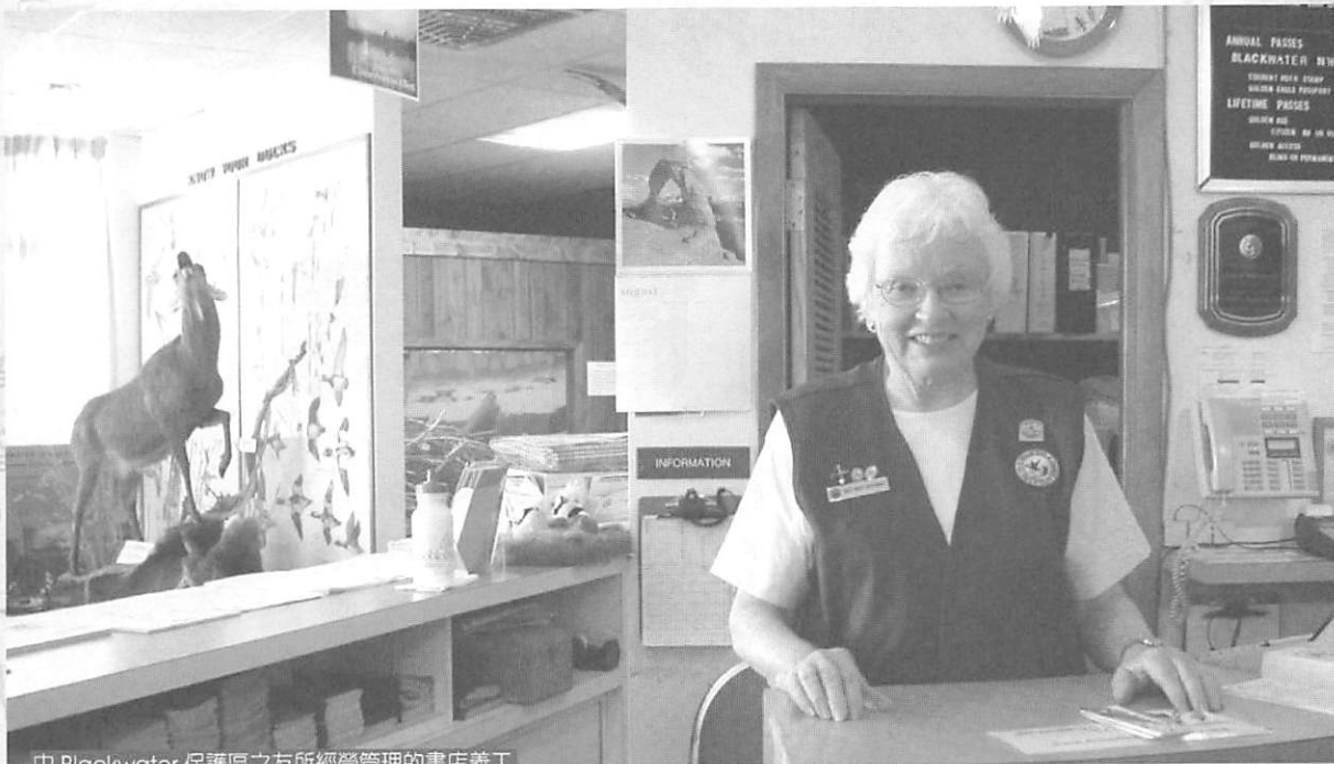
由 Blackwater 保護區之友所經營管理的書店義工