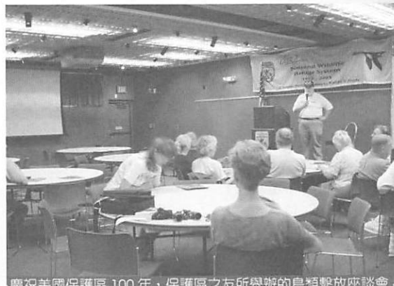
慶祝美國保護區 100 年，保護區之友所舉辦的鳥類繫放座談會