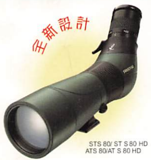
STS 80/ST S 80 HD ATS 80/AT S 80 HD