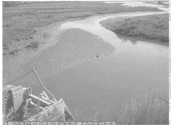
藉由水位控制而創造出不同棲地的水域深淺

註：鴨票：美國法律規定，狩獵野生動物，除了需配合開放的節令，還需向政府購買狩獵證，而狩獵雁鴨者，另外還需購買鴨票，釣魚則需垂釣證，政府再將這些收入，回饋用在野生動物相關的事務上，藉此鼓勵民眾參與。