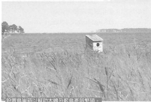
設置鳥巢箱以幫助木鴨及藍鳥產卵繁殖。