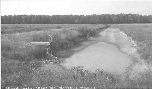
Blackwater NWR 進行水位控制的情況

保存及棲地環境的維護上頭，往往僅流於禁止所有干擾行為的進行，實際的經營管理工作卻因專業人力及經費預算的不足而無法真正落實，然棲地環境會演替、族群會消長，如果不進行必要的棲地環境經營管理的工作，實有負劃設保護區之美意。另外，持續性的環境及生物生態監測工作也是相當重要的，在美國的保護區裡，由於編制有固定的人力及經費，相當重視這一個環節，如此不僅隨時掌握某些保育類物種族群變化情形，也能進而對保護區內環境動態及其他生物族群分布變化了解，對於保護區範圍的調整、棲地環境的營造與規劃，都能有最基礎的資料可以提供參考。反觀我國，由於人力物力的有限，許多保護區內環境生物及生態監測，往往在劃設後就停止了，或是依不同年期委交給不同的研究單位進行監測，如此往往因為各方層面上的調整而影響到資料累積的完整性與一致性，對於我國未來保護區整