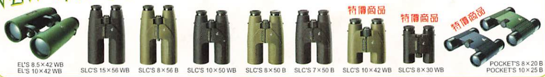
EL'S 8.5x42 WB EL'S 10x42 WB